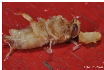
Tote Puppe auf Flugbrett