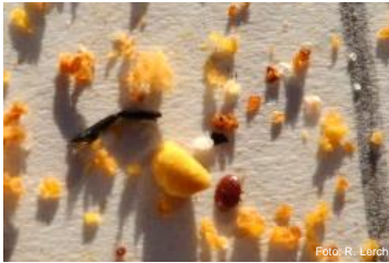
Tote Milbe auf Unterlage