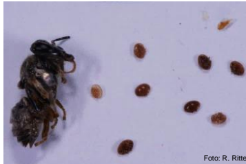
In Zelle gefundene Biene mit ihren Milben