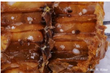
Stark varroabefallene Zellen