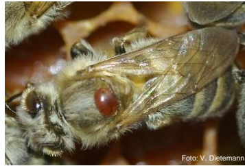
Varroa auf Stockbiene