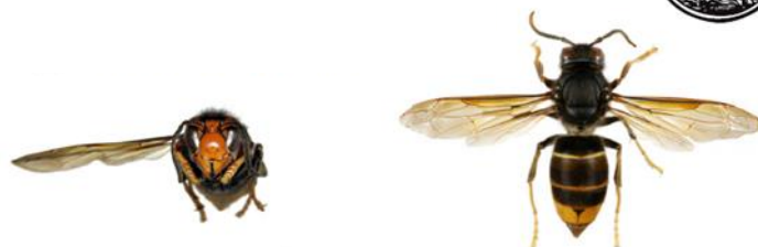
Asiatische Hornisse, Vespa velutina

Die Asiatische Hornisse (englisch : Yellow-legged Hornet), Vespa velutina , hat eine schwarze Grundfärbung mit einem breiten orangen Streifen am Hinterleib und einer feinen gelben Binde am ersten Segment. Die Kopfvorderseite ist orange, die Beinenden sind gelb . Die Körperlänge beträgt zwischen 17 und 32 mm.