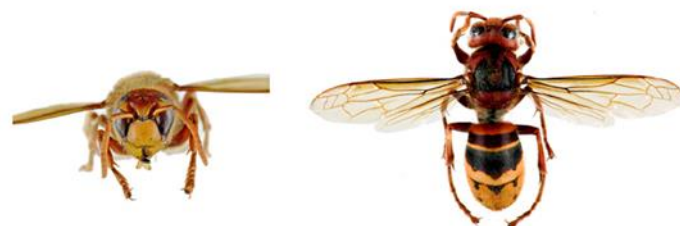
Europäische Hornisse, Vespa crabro

Die Europäische Hornisse , Vespa crabro , hat einen überwiegend blassgelben Hinterleib mit schwarzen Streifen. Die Kopfvorderseite ist gelb, die -oberseite rot gefärbt. Brust und Beine sind schwarz und rotbraun . Arbeiterinnen erreichen eine Körperlänge zwischen 18 und 23 mm und Königinnen zwischen 25 und 35 mm.