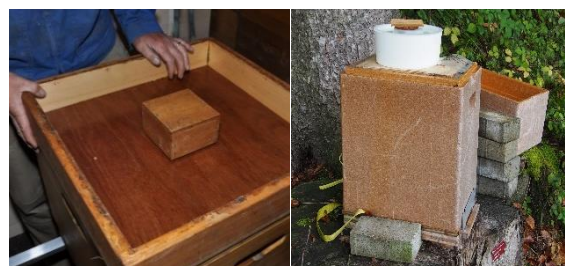
Ruche divisible (2 différents nourrisseurs)