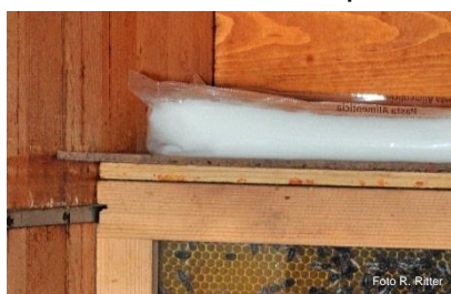
Ruche suisse (pâte de nourrissage d'urgence)

Au printemps, contrôlez les réserves de nourritures de vos colonies. Si à cette saison les abeilles se trouvent directement sous les couvre-cadres/toits, cela pourrait indiquer un manque de nourriture. Si tel est le cas, retirez les cadres de nourriture vides et remplacez-les par des pleins (approcher les plus éloignés vers le nid à couvain ou donner aux colonies leurs propres cadres de réserve). S'il n'y a plus de cadres de nourriture à disposition, la pâte de nourrissage doit être placée directement sur la tête des cadres. L'eau de condensation résultant du couvain qui se trouve en dessous permet aux abeilles de se nourrir.