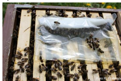
Ruche divisible (pâte de nourrissage posée directement sur les cadres)

Vidéo correspondante , réalisée par téléphone portable