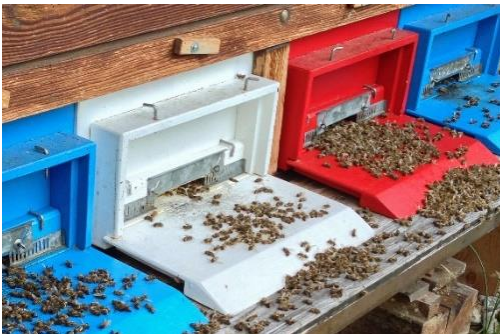
Intoxication aiguë avec un très grand nombre d'abeilles mortes devant le trou de vol.